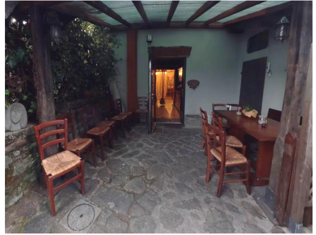
38 Spazio esterno