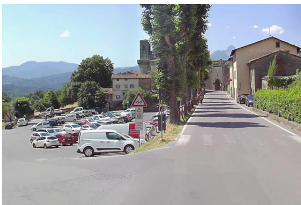
8 Percorso dal parcheggio a Porta Nuova