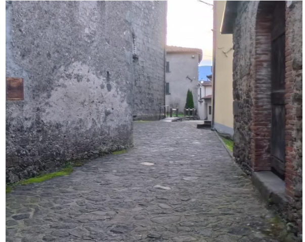
18 Ultimo tratto per la Chiesa di San Michele