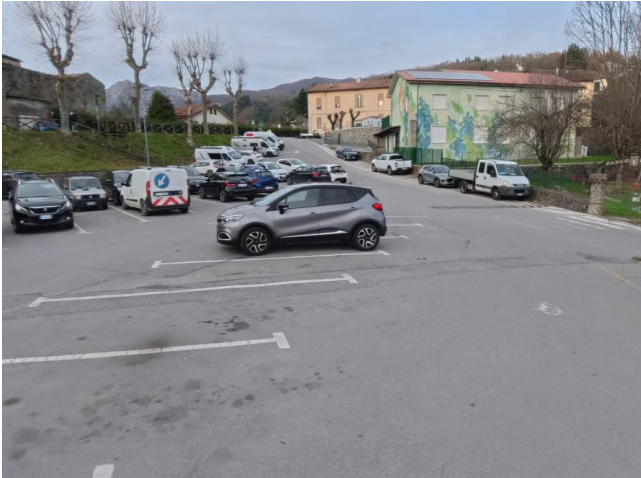
1 Parcheggio Via di Soccorso