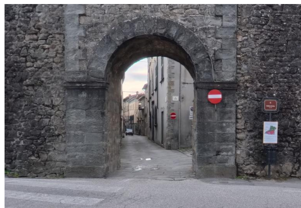
9 Porta Nuova

Superata la porta, si entra nel borgo e, svoltando a destra, si imbecca Via San Pietro , proseguendo per un tratto di circa 60 metri fino a incontrare il Torrione di San Pietro , elemento delle antiche fortificazioni.