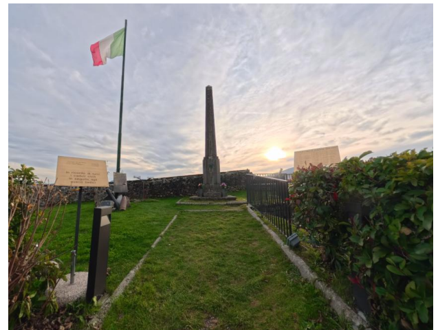
34 Interno Parco della Rimembranza

Progetto realizzato con il contributo della