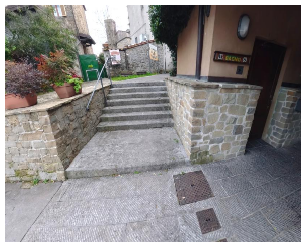
7 Servizi igienici accessibili parcheggio Via Soccorso e adiacente scalinata che collega a ingresso borgo