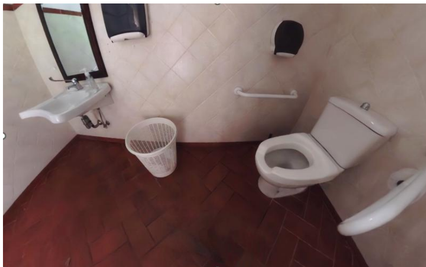
44 Interno bagno parcheggio Via Soccorso

Progetto realizzato con il contributo della