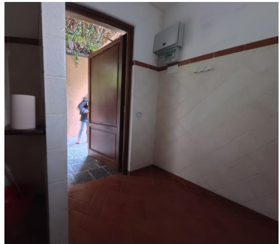
43 Ingresso interno bagno