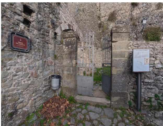
15 Esterno ingresso rocca