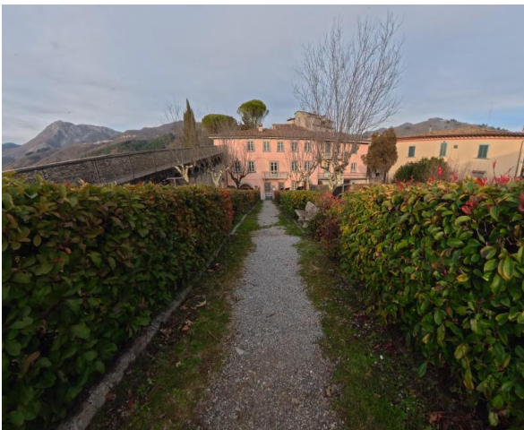
33 Interno Parco della Rimembranza