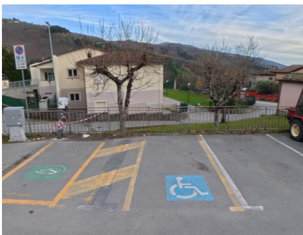
6 Posto riservato parcheggio Via di Soccorso

Nota: Questo percorso è stato scelto per evitare una scalinata che, partendo direttamente dal parcheggio, consentirebbe un accesso più rapido al borgo.