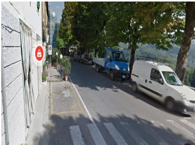
4 Parcheggio riservato Via Massimo D Azeglio