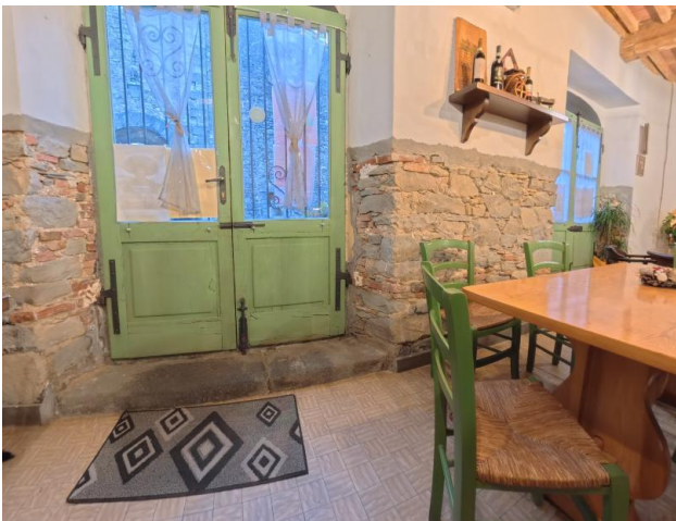
39 Ingresso interno