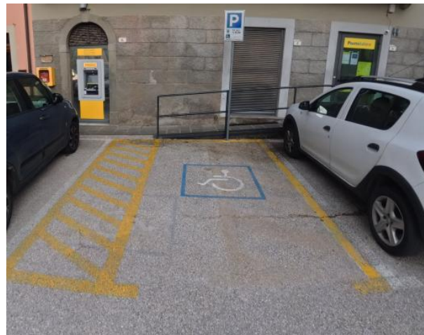
5 Parcheggio riservato Piazza Vittorio Emanuele