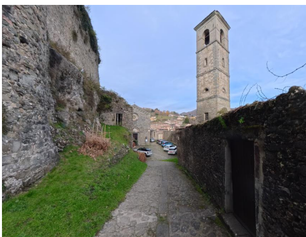
13 Percorso da Chiesa a Rocca

Per informazioni aggiornate su apertura e accessibilità si consiglia di contattare la Pro Loco di Castiglione di Garfagnana, in quanto alcune aree potrebbero essere visitabili solo con assistenza o risultare non accessibili.