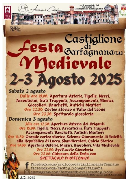
36 Locandina tipica Festa Medievale

Tra gli eventi più importanti spicca la Festa Medievale , che si svolge ogni anno il 3 e 4 agosto: durante queste giornate il borgo si anima con rievocazioni storiche, mercatini e osterie, offrendo ai visitatori un'immersione completa nelle atmosfere del passato.