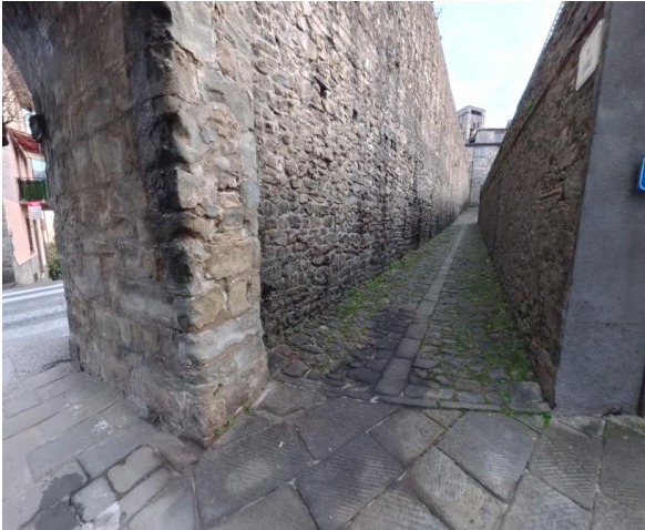
17 Via Civaldi