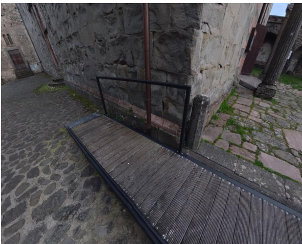
19 Prima rampa per accedere al sacro della Chiesa