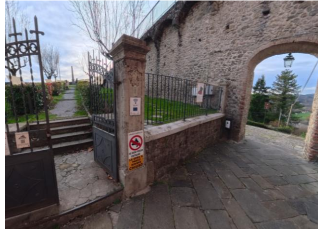
32 Ingresso Parco della Rimembranza