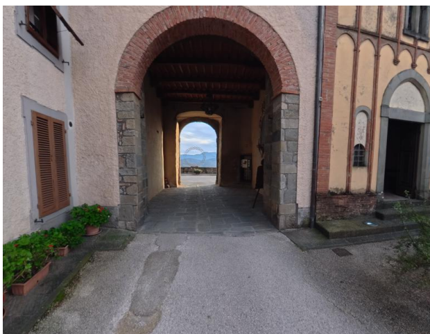
29 Porta ponte levatoio