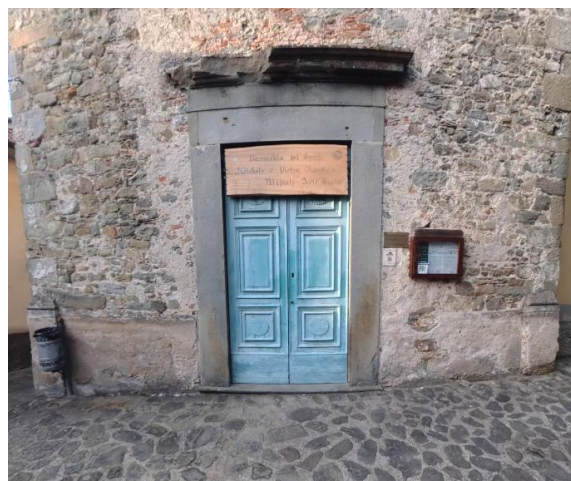
22 Ingresso Museo arte sacra

Per proseguire il percorso, si ritorna all'incrocio con Via Roma – situata direttamente di fronte alla porta del borgo – e si svolta a sinistra, rimanendo sull'asse principale. Si prosegue quindi lungo la via per circa 130 metri fino a raggiungere Piazza Vittorio Emanuele , dove si trova sulla destra il Comune di Castiglione di Garfagnana e, sulla sinistra, a pochi metri, l' Oratorio di Sant'Antonio , situato in prossimità della Porta Levatoia .