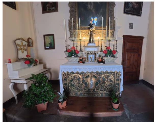
28 Interno Oratorio San Antonio

Progetto realizzato con il contributo della