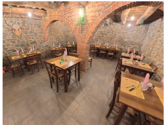
40 Sala interna

Progetto realizzato con il contributo della