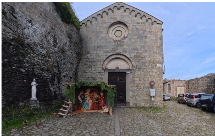
12 Chiesa San Pietro

Da qui il percorso prosegue in salita verso uno dei punti più significativi del borgo, la Rocca di Castiglione di Garfagnana, che rappresenta il punto più elevato dell'itinerario e offre una posizione panoramica.