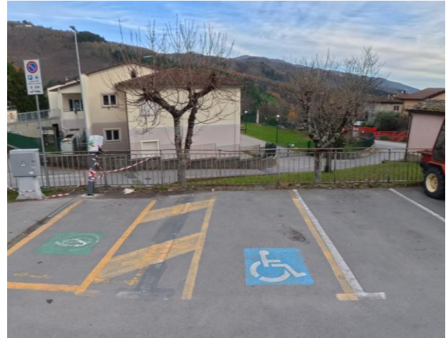
2 Posto riservato Via di Soccorso