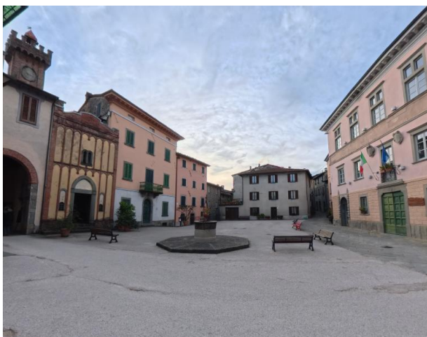
23 Piazza Vittorio Emanuele

La Chiesa di Sant'Antonio non presenta accessi agevolati: l'ingresso principale, di ampia larghezza, presenta due gradini e una soglia per un dislivello complessivo di circa 18 cm. L'interno della chiesa risulta comunque accessibile una volta superata la soglia d'ingresso.