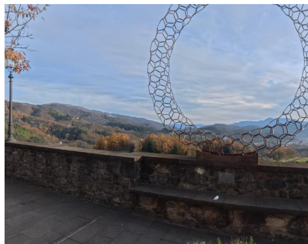
30 Panorama fuori Porta ponte levatoio

Da Piazza Vittorio Emanuele, si riprende Via Roma e si prosegue per circa 100 metri in piano, su strada con pavimentazione scorrevole lastricata in pietra. Al termine del tratto, si trova sulla sinistra l'ingresso al Parco della Rimembranza e, di fronte, la tappa finale dell'itinerario: Porta degli Inferi .