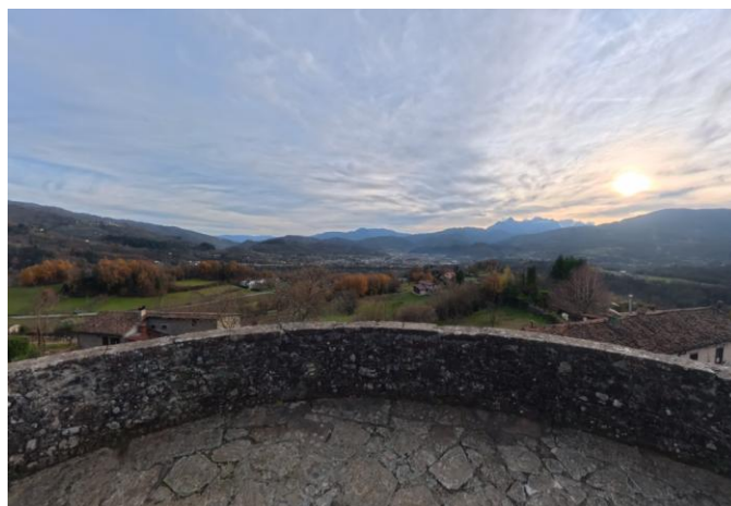
35 Panorama da Parco della Rimembranza