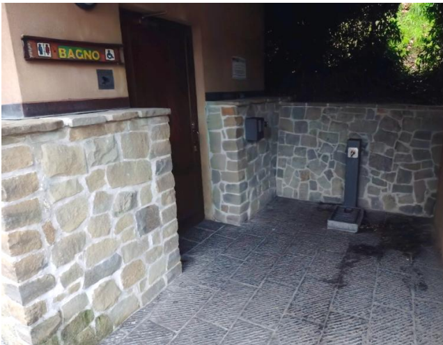
42 Ingresso esterno bagno