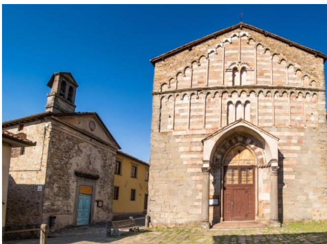
21 Facciata Chiesa