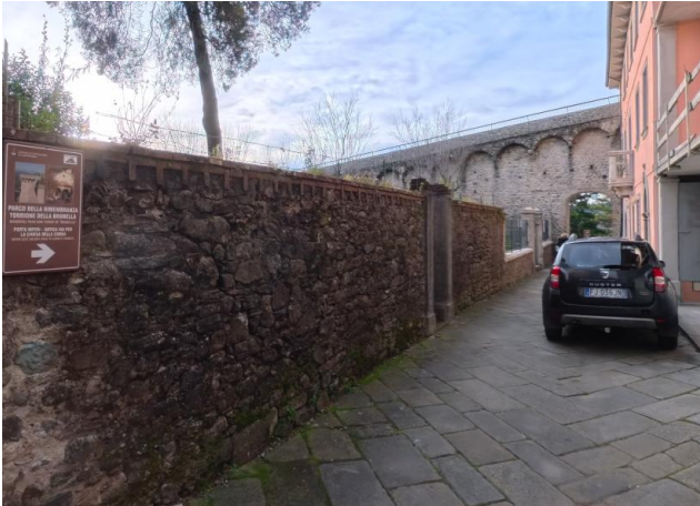
31 Via Roma verso Parco Rimembranza e Porta degli Inferi