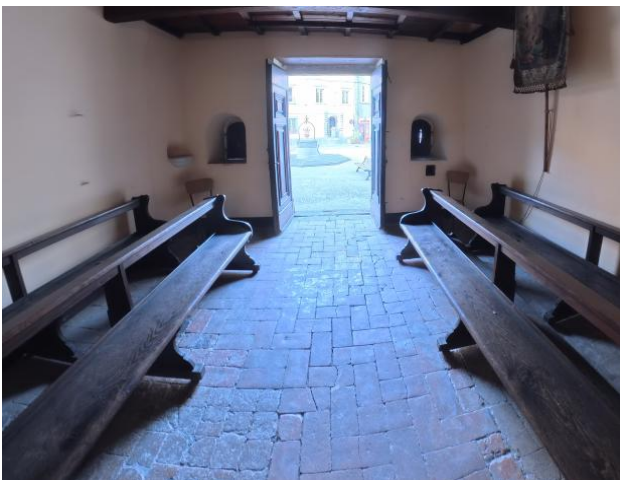
27 Interno Oratorio San Antonio