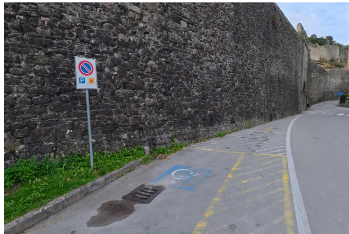
3 Posto riservato lungo mura, vicino a Porta nuova

Progetto realizzato con il contributo della