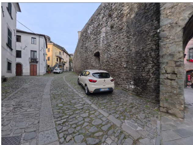
10 Via San Pietro

Non sono stati rilevati totem o sistemi informativi accessibili lungo il percorso.