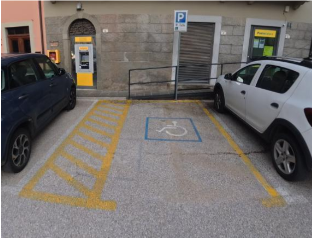
25 Posto riservato in Piazza Vittorio Emanuele