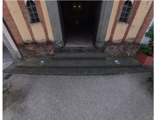
26 Ingresso oratorio San Antonio