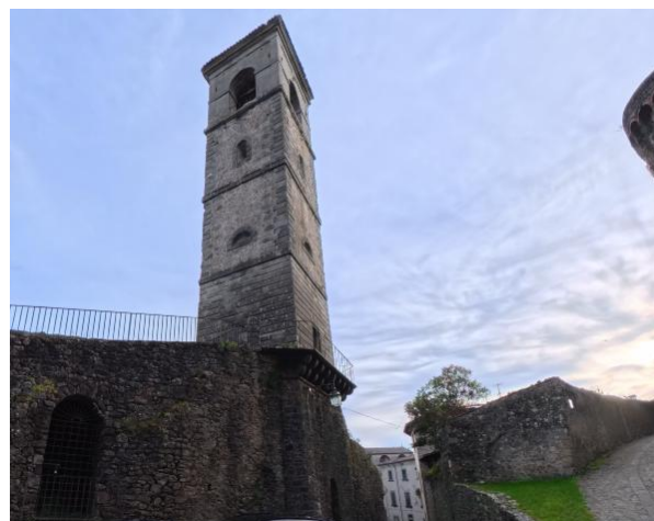
11 Torrione San Pietro