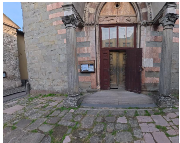
20 Seconda rampa per accedere all'ingresso della Chiesa

Progetto realizzato con il contributo della